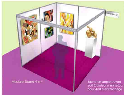
Module Stand 4 m 2