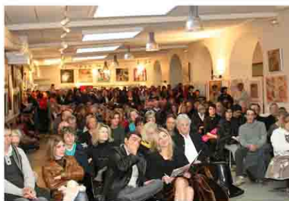
La vente au enchères est un «plus» qui a permis de faire vendre plus de 150 000 € d'oeuvres d'Art...

ARTOULOUS'EXPO est à la fois, un concours , une exposition générale, une vente aux enchères et la possibilité d' avoir votre propre stand afin de pouvoir vendre vos oeuvres dans un Salon d'Art de très belle qualité et fréquentation. C'est un «format» unique en France qui favorise et multiplie la possibilité pour les artistes : ■ de vendre leurs oeuvres auprès du public, ■ d'accéder à une côte réelle grâce à la vente aux enchères en clôture de l'événement.